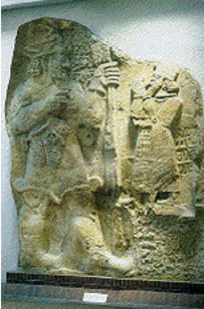
Figura del dios, 4,20 m de altura