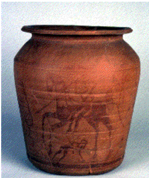
Vasija de los guerreros de Archena